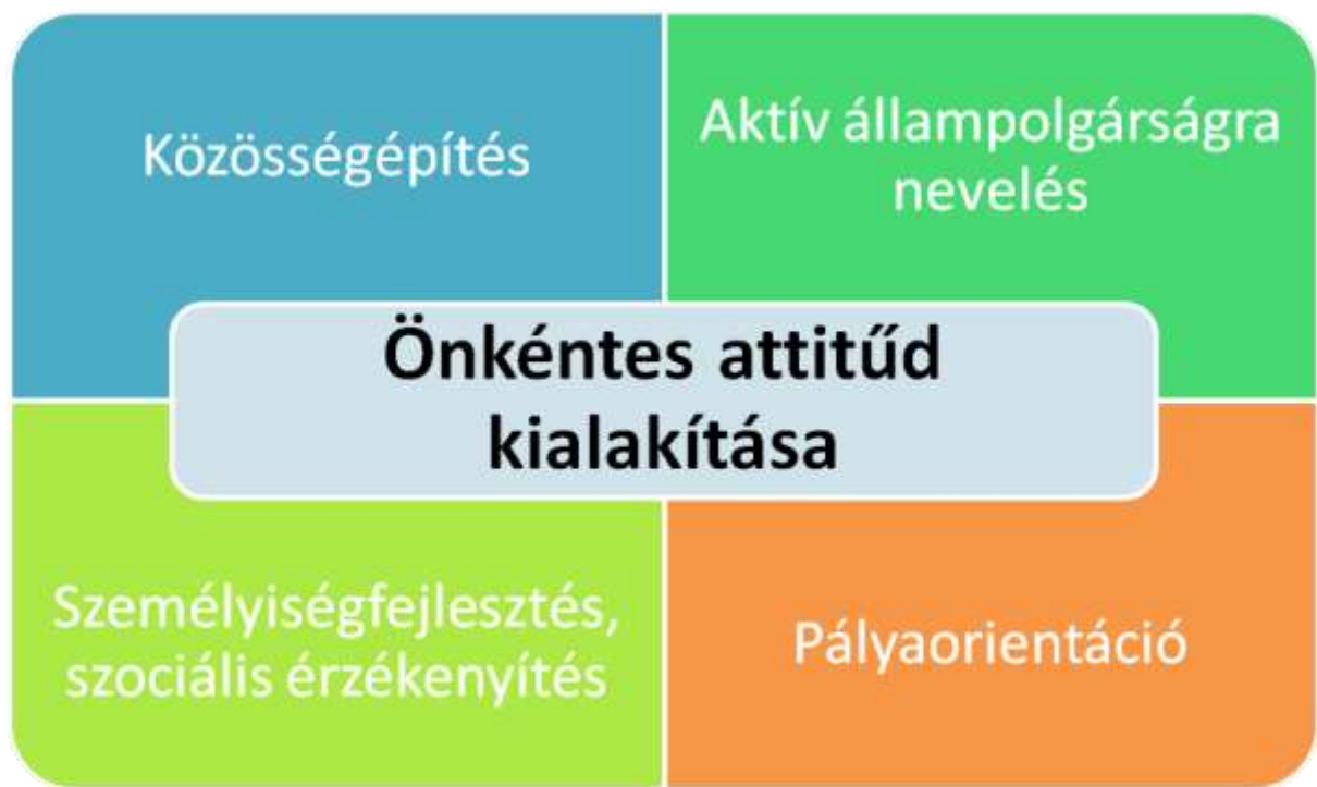
2. ábra A közösségi szolgálat fő céljai

Magyarország Kormánya a 2011. december 23-án elfogadott Nemzeti köznevelési törvénnyel bevezette az iskolai közösségi szolgálatot , mint az érettségi előfeltételeként kötelezően teljesítendő tevékenységet. Ez a tanulók különböző készségeit és kompetenciáit fejlesztő pedagógiai eszköz, mely hozzájárul ahhoz, hogy a középiskolás tanulók megismerjék a közösségben való tevékenykedés erejét, az ily módon szerzett tudásukat életük során jól hasznosíthatják. Az iskolai közösségi szolgálat sokféleképpen megvalósítható tevékenység, mely megvalósulási helyétől és formájától függetlenül a közösség érdekét is szolgálja az egyén személyiségének fejlesztése mellett.